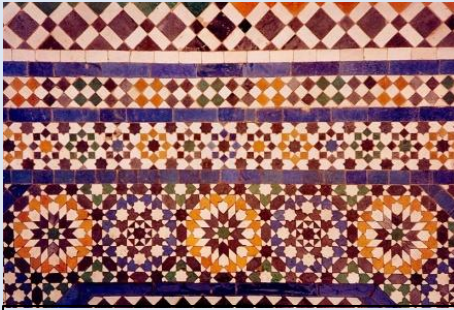
Mosaico islámico – Marruecos.