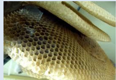
Teselación Natural Panal de abeja